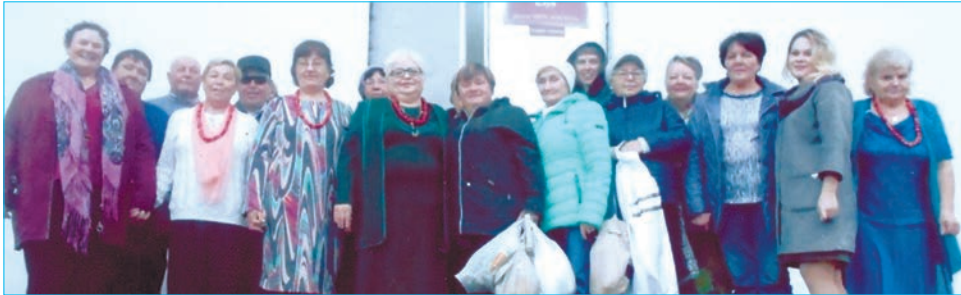
В Горноисетском клубе чествовали старшее поколение