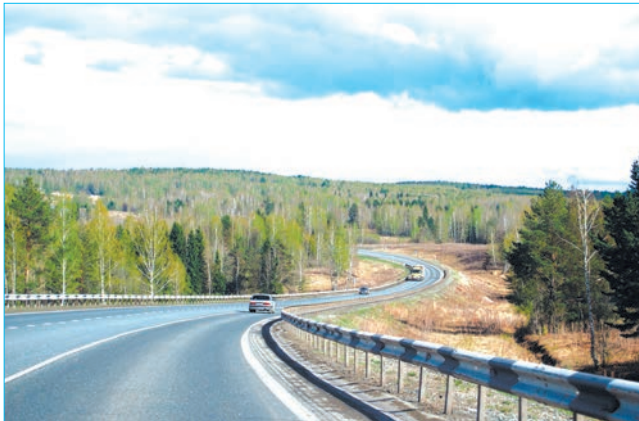
21 октября – День работников дорожного хозяйства

«Всего в 2018 г. в Свердловской области было отремонтировано 24 км федеральных трасс», – сообщает пресс-служба ФКУ «Уралуправтдор».