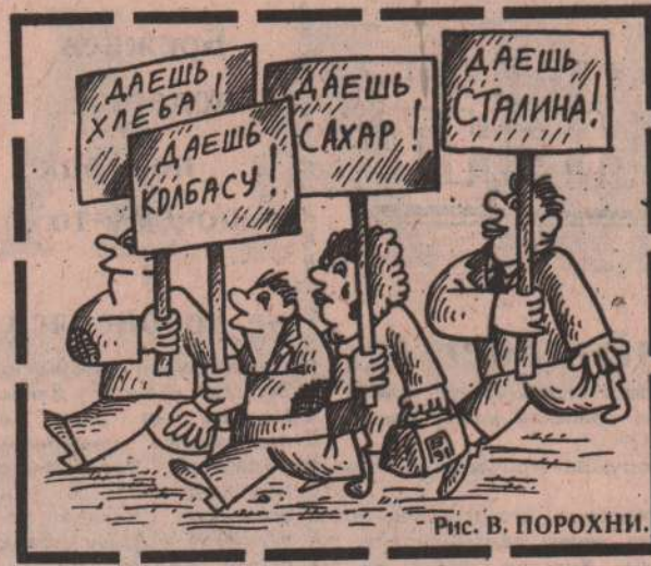
Рис. В. ПОРОХНИ.