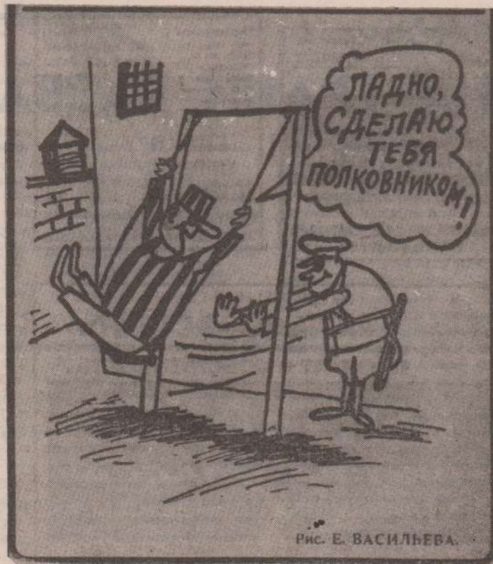
Рис. Е. ВАСИЛЬЕВА.