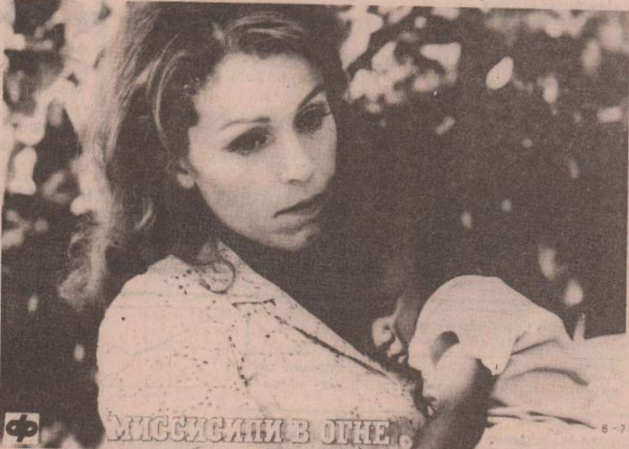
Миссисипи в огне

Л. ВАСЕНИНА, методист Каменской районной дирекции киносети.