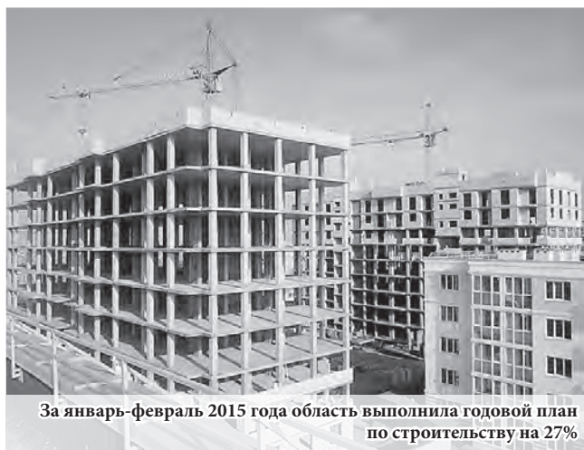
За январь-февраль 2015 года область выполнила годовой план по строительству на 27%

На 2015 год губернатор поставил задачу перед министерством строительства и главами городов – достигнуть установленных по-