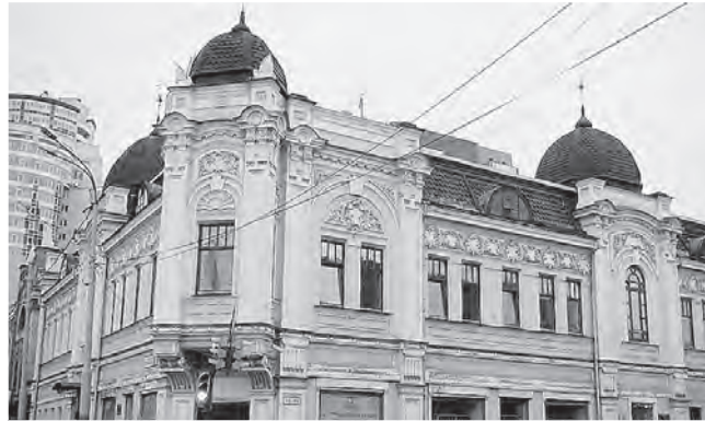
В Екатеринбурге это здание построено купцом Перушиным в начале XX века. В годы Великой Отечественной войны здесь работал прославленный радиодиктор Юрий Левитан. На здании установлена мемориальная доска.

Директор департамента государственной охраны культурного наследия министерства культуры России Владимир Цветнов особо отметил новаторские подходы и методы