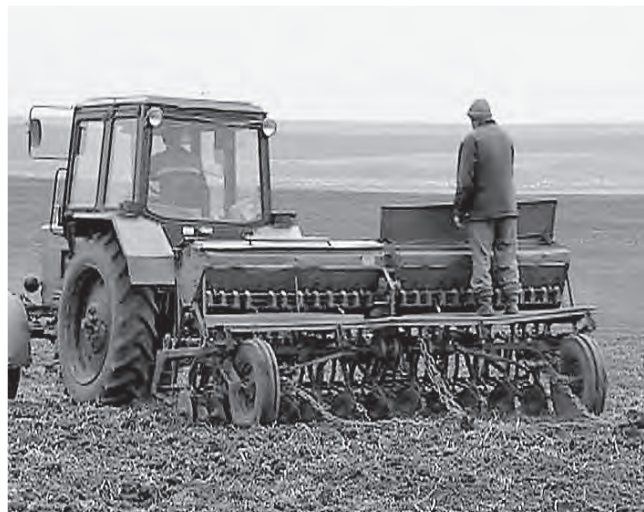
20 тысяч тонн минеральных удобрений вносят на поля в этом году

Подготовка к посевной кампании в Свердловской области идёт по плану, о чём сообщили в региональном министерстве АПК и продовольствия. Сегодня заготовлено 100% требуемых семян: 104 тысячи тонн зерна и зернобобовых культур, 45 тысяч тонн картофеля. Аграрии продолжают приобретать минеральные удобрения. На поля области в этом году планируется внести 20 тысяч тонн действующего вещества минеральных удобрений, что соответствует уровню прошлого года.