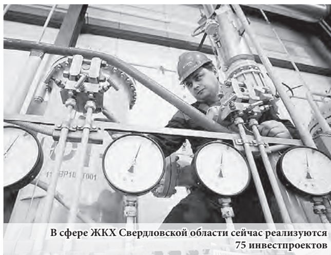
В сфере ЖКХ Свердловской области сейчас реализуются 75 инвестпроектов

Напомним, это не первое включение Свердловской области в список наиболее эффективных субъектов страны в сфере