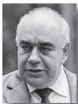
Аркадий Белявский, министр здравоохранения Свердловской области:

«Мы смещаем акцент с оказания медицинской помощи в круглосуточных стационарах на поликлиническую и амбулаторную помощь. В результате всех преобразований: оптимизации сети учреждений, внедрения эффективных контрактов удалось сэкономить 558 миллионов рублей, которые были направлены на повышение заработной платы медицинским работникам».