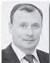
Алексей Орлов, первый вице-премьер – министр инвестиций и развития Свердловской области:

В областной фонд поддержки предпринимательства поступило свыше двух тысяч заявок на предоставление средств. На финансовую поддержку 700 субъектов предпринимательской деятельности было направлено 912,4 миллиона рублей. Субсидии направлялись на модернизацию, на уплату первого платежа по лизингу.