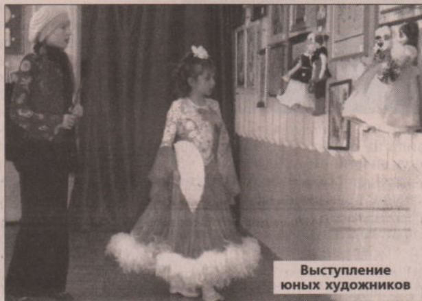
Выступление юных художников