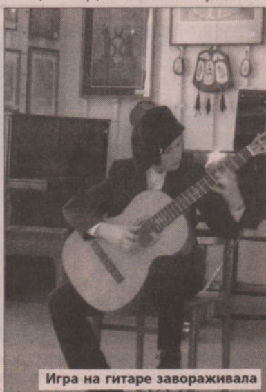
Игра на гитаре завораживала