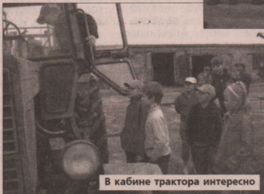
В кабине трактора интересно

тракторист, но позволил, и парни, поблескивая глазами, горделиво поглядывали из кабины на девочек: «Куда вам до нас!»