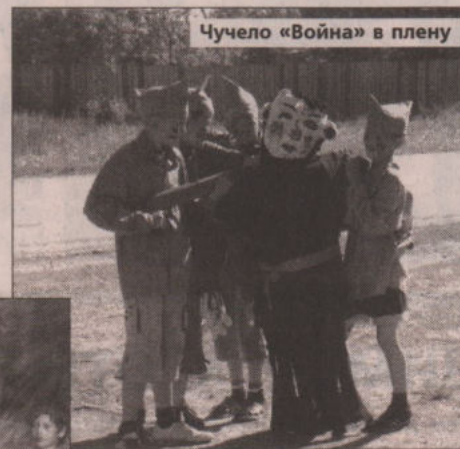
Чучело «Война» в плену