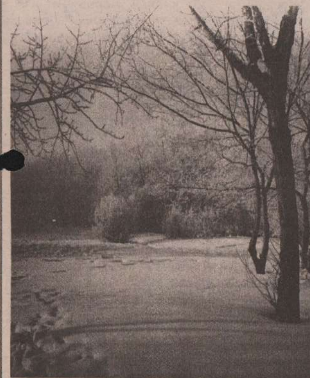
Фотоэтиюд В. Меркурьева (из архива редакции)