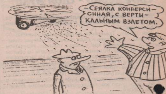
Рисунок В. Жабского.