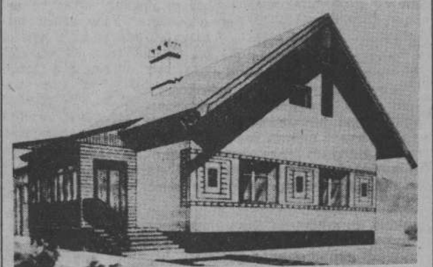
Дом из кирпича. Одноквартирный 3-комнатный. Жилая площадь — 49,4 квадратных метра. Сметная стоимость — 25 тысяч рублей.