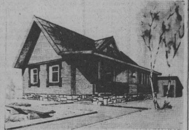
Одноквартирный 4-комнатный жилой дом из дерева. Жилая площадь — 57 квадратных метров. Сметная стоимость — 19 тысяч рублей.