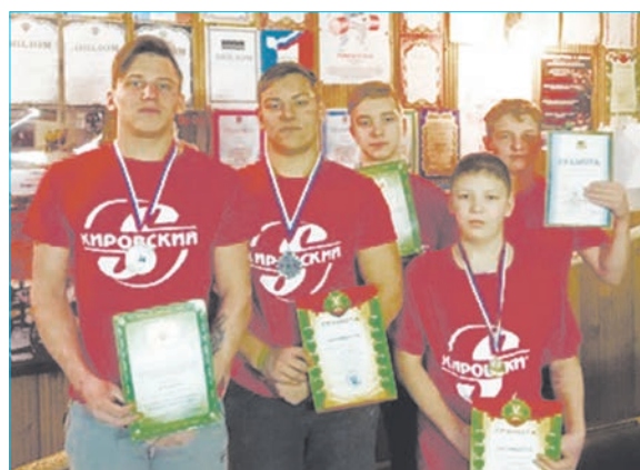
Чемпионы с наградами

23 декабря в Полевском прошел областной турнир по жиму штанги лежа и становой тяге среди юношей, в нем приняли участие около 100 спортсменов.