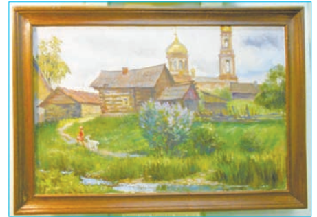
Тема Родины близка художнику

Выставка П.В. Андрюкова продлится в музее до конца января 2019 г. Порядок посещения: с 14 до 18 час., кроме воскресенья и понедельника. Вход свободный.