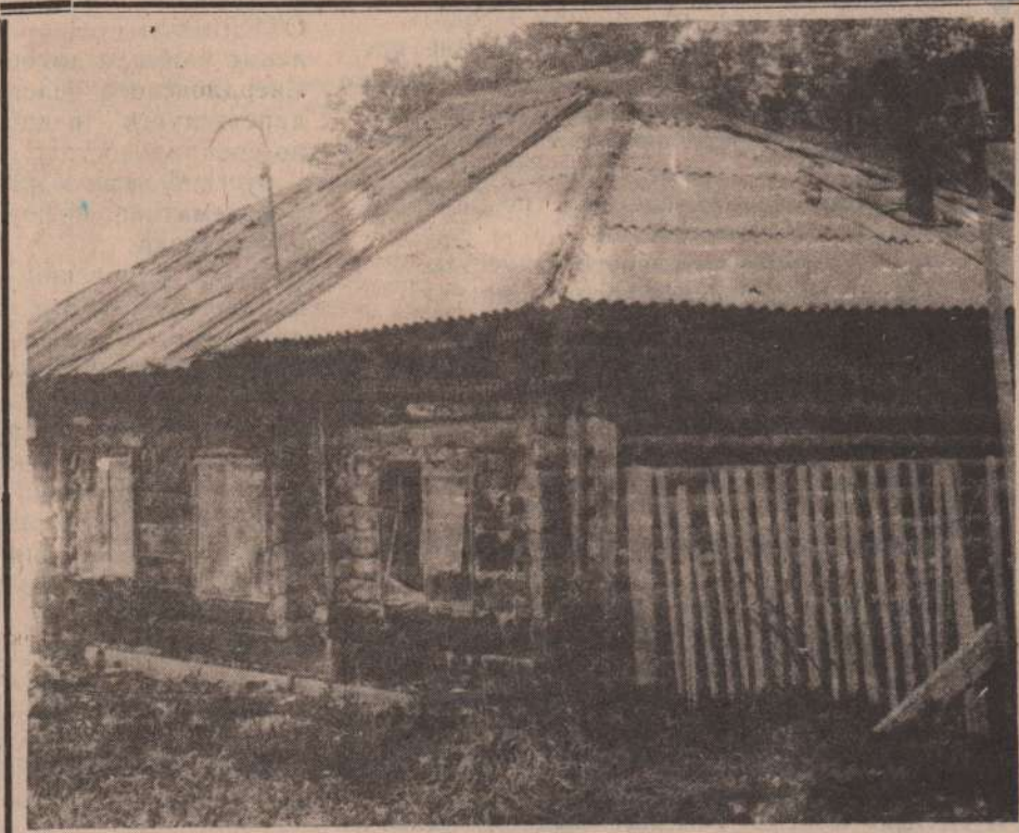
Адрес: деревня Часовая.