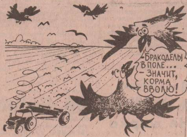
Рисунок В. Жабского.