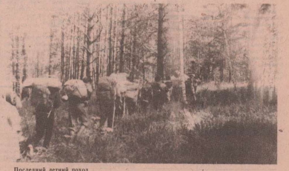
Последний летний поход