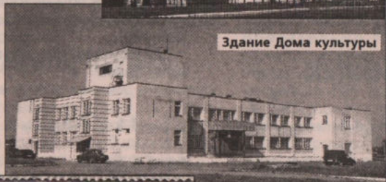
Здание Дома культуры