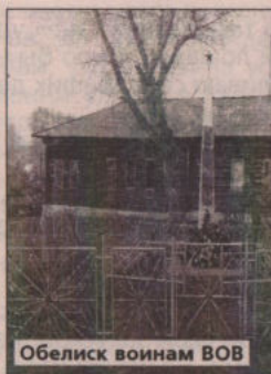
Обелиск воинам ВОВ