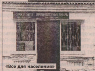
«Все для населения»

ментов, было добыто в селе Шиловском Маминской администрации. Не случайно на этой территории открыты 20 новых для Урала минералов, а два минерала не были известны и для всего мира.