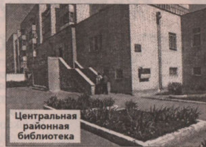
Центральная районная библиотека

Центр - поселок Мартюш, в состав входили д. Брод, Байнова, Ключи, Токаревка, Майка с 1943 года деревня Майка переименована в Мартюш. В 1978 году передан Щербаковский сельский Совет и село Щербаково относится к Бродовскому сельсовету.