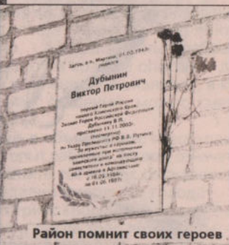
Район помнит своих героев

КИСЛОВСКИЙ СЕЛЬСКИЙ СОВЕТ существует с 1925 года, включает населенные пункты: с. Кисловское и д. Соколова, п. Лебяжье.