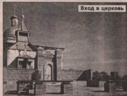
Вход в церковь

кого завода. Кисловцы раньше других организовали потребительскую кооперацию и кредитное товарищество, которое в 1906 году открыло в селе хорошую библиотеку. В 1929 году в с. Кислово имелось 373 двора с населением 1666 человек.