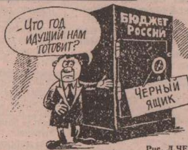
Рис. Л. ЧЕРНЫХ.