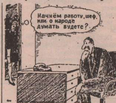
Рис. Н. КИНЧАРОВА (г. Волгоград)