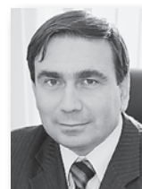
Как доложил губернатору министр энергетики и ЖКХ Свердловской области Николай Смирнов , план 2014 года по переселению из аварийного жилья область выполнила на 225%. Глава ведомства отметил, что в настоящее время на территории региона начался очередной этап программы по переселению граждан из аварийного жилья. В ней принимают участие 20 муниципалитетов. Планируется, что к концу 2015 года в новостройки будут расселены жители из 210 аварийных строений общей площадью около 50000 кв. метров. Условия проживания улучшат 3000 человек.

«Никаких поблажек и переносов срока сдачи жилья и переселения граждан из аварийного жилья не допускается. Всё, что намечено в показателях программы, мы должны исполнить в строго установленный срок», – пояснил министр.