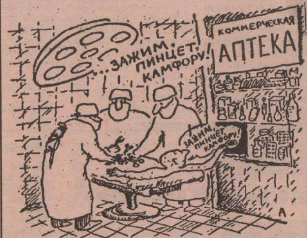
Рис. А. БОНДАРЕВА.