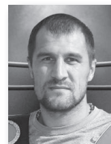
Сергей Ковалёв, чемпион мира по боксу по версиям IBF, WBA, WBO:

Встреча двух именитых боксёров, которая состоится в дни проведения на Среднем Урале главной промышленной выставки страны ИННОПРОМ и Российско-Китайского ЭКСПО, гармонично впишется в программу этих международных форумов, уверен губернатор Евгений Куйвашев.