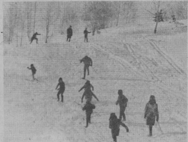
По первому снегу.

— По зимнему календарному плану намечено 27 мероприятий, из них лыжных — восемь. 28 ноября открытие сезона по хоккею, 29 — по лыжам. Счастливых стартов!