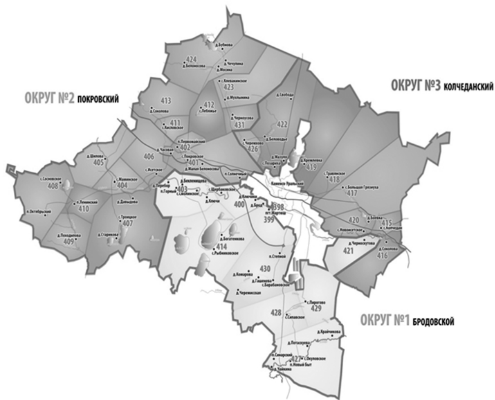
Схема пятиимандатных избирательных округов для проведения выборов депутатов Думы Каменского городского округа