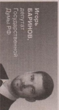
Игорь БАРИНОВ, депутат Государственной Думы РФ

— Народный бюджет — это новая форма обсуждения и принятия бюджета страны, регионов и муниципалитетов, которую предложили депутаты «ЕДИНАЯ РОССИЯ» и Общероссийский народный фронт. Впервые свердловчанам предстоит самим определить, какие шаги по развитию территории необходимо предпринять в первую очередь: будет ли это строительство школ или больницы, возведение моста или ремонт дороги. И появление новых социальных объектов в городе или поселке, в котором вы живете, теперь напрямую зависит от вашей активности. Не упустите свой шанс принять участие в работе над Народным бюджетом, высказать свое мнение о предлагаемых Народной программой проектах, которые планируются реализовать на вашей территории.