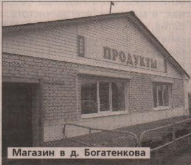
Магазин в д. Богатенкова