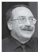
Даниил Крамер, народный артист России:

– В Год культуры в Свердловской области проходит множество знаковых мероприятий. Это и музыкальный фестиваль имени Чайковского в Алапаевске, и музыкальные вечера в дни Ирбитской ярмарки. Фестиваль «URALTERRAJAZZ» повышает привлекательность города Камышлова.