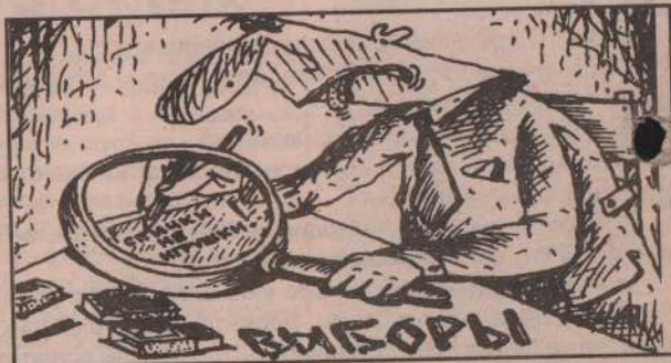
Рисунок Аркадия Пяткова.

Удлинить жизнь можно только не укорачивая ее.