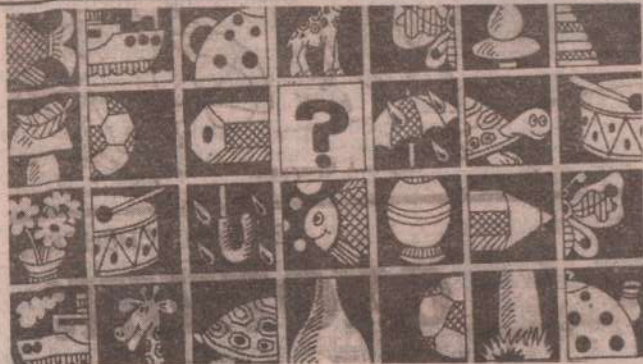
Половину какого рисунка забыл изобразить художник?

Корней Чуковский (охи) Борис Заходер. (ленс ичварелл)