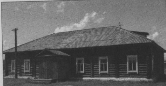
Здание бывшего ДК