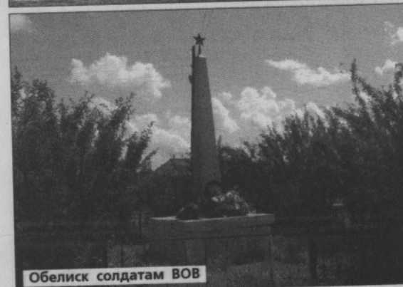
Обелиск солдатам ВОВ