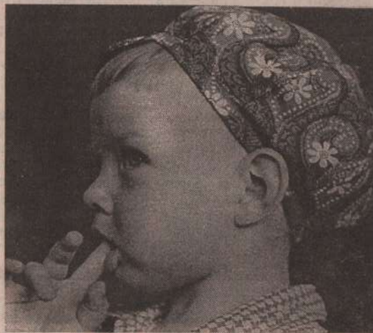
А я вот думаю: "Мои родители выписали газету "Пламя"?"

Напоминаем: выписать газету "Пламя" можно каждый месяц. Среди территорий, где у нас больше всего друзей-подписчиков, лидирует с. Покровское, на втором месте с. Сосновское, на третьем - с. Маминское.