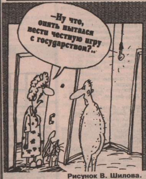
Рисунок В. Шиловой.