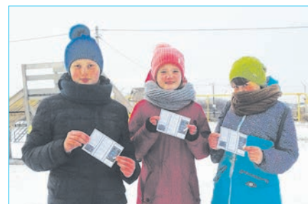
В ходе акции