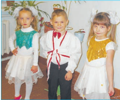
Маленькие артисты поздравили мам