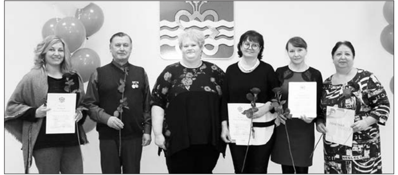
Члены избирательных комиссий получили награды

На торжественном мероприятии многие члены избирательных комиссий были награждены почетными грамотами, благодарственными письмами различных уровней. Так, Благодарственным письмом ЦИК РФ награждена председатель