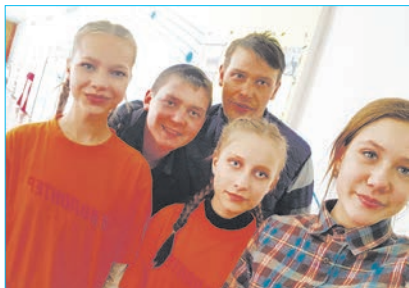
Дарят добро и позитив

Ребятам пришлось потрудиться физически: найти безопасную поляну, обкосить ее, поставить разметку, организовать палаточный лагерь, привезти и установить музыкальную технику. На протяжении многих лет этот фестиваль развивался, и помощь волонтеров с каждым годом становилась