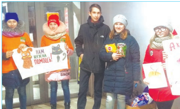
Активисты призывают помочь бездомным животным

Ребята оформили плакаты и рисунки, с которыми и вышли к двум магазинам в нашем поселке. Первые пакеты с кормом были приобретены самими организаторами акции. Последовали примеру ребят и другие прохожие – взрослые и дети Мартюша приняли активное участие в акции. Результат – большая коробка с кормом для кошек и собак. И «Незаменимым» очень понравилось проводить эту акцию, они увидели результат. Решено акцию сделать традиционной и проводить ежемесячно.