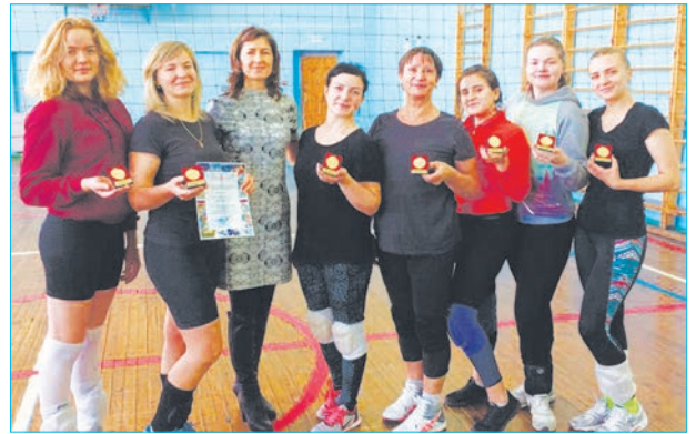
Призеры турнира по волейболу