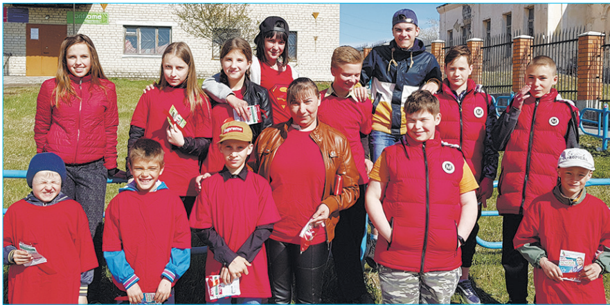
Волонтеры – самые активные ребята Покровского

Молодые люди со свойственным им энтузиазмом проводят субботники «Село – мой дом», «Зеленая Россия». Патриотизм и волонтерство – понятия, у которых очень много общего. Совместно с Советом ветеранов, Женсоветом активная молодежь проводит акции «Бессмертный полк»,