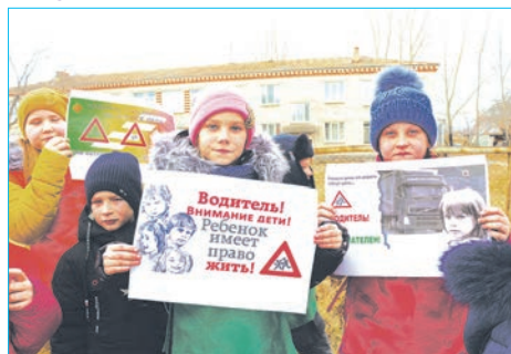
Привлекли внимание водителей

Третье воскресенье ноября объявлено Всемирным днем памяти жертв дорожно-транспортных аварий: во всем мире в результате дорожно-транспортных происшествий ежедневно погибает более трех тысяч человек и около 100 тыс. получают серьезные травмы.