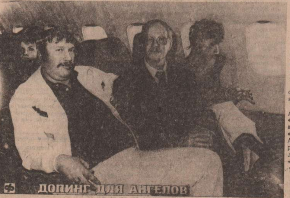
ДОПИНГ ДЛЯ АНГЕЛОВ