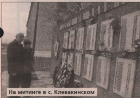
На митинге в с. Клевакинском