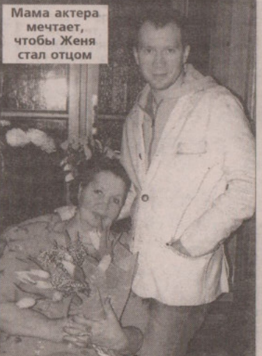
Мама актера мечтает, чтобы Женя стал отцом