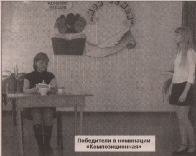
Победители в номинации «Композиционная»