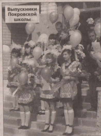
Выпускники Покровской школы