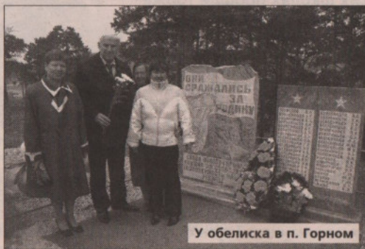
У обелиска в п. Горном

В завершение митингов селяне почтили память погибших солдат минутой молчания и возложением цветов к обелискам.