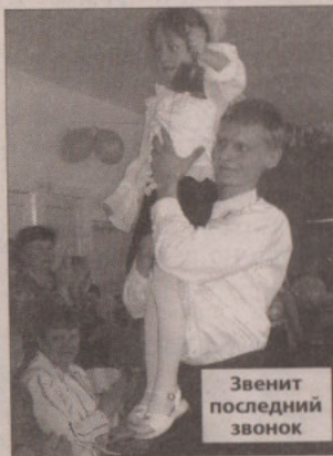
Звонит последний звонок