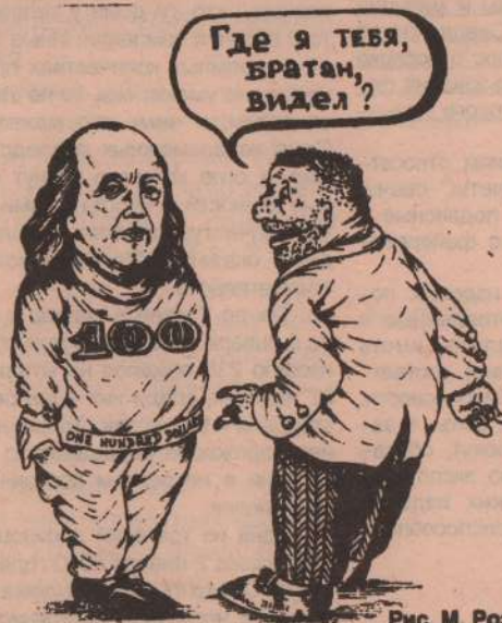
Рис. М. Розановой.