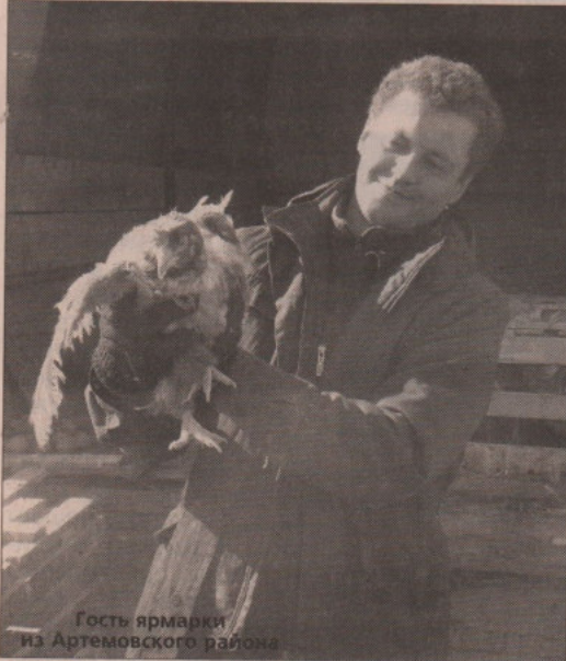
Гость ярмарки из Артемовского района