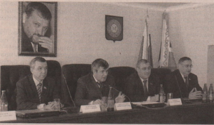
Делегация Законодательного Собрания Свердловской области посетила Чеченскую Республику

Свердловская область стала первым регионом России, чья официальная делегация посетила Чечню после завершения вооруженного конфликта на ее территории. На встречах с депутатами, руководителями республиканских органов исполнительной власти, деятелями культуры, медицинскими работниками – всюду звучала мысль: Чеченская Республика прочно встала на путь мирного, демократического развития, вновь подтвердив, что является неотъемлемой частью великой России.