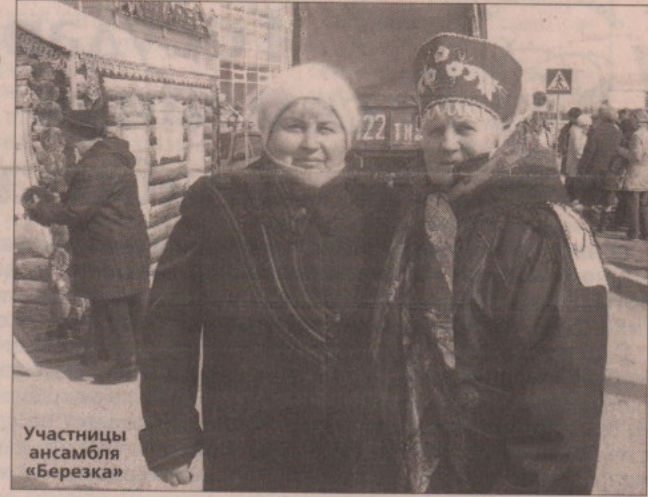
Участницы ансамбля «Березка»