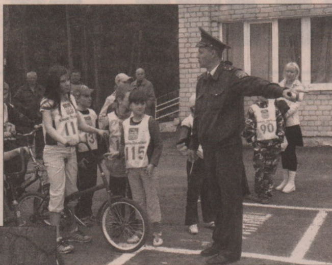
Юные велосипедисты на старте

В мероприятии приняли участие команды из 41 школы города и района. Ребятам предстояло пройти пять этапов. Для начала их ожидал экзамен по теории на знание правил дорожного движения. Второй этап был намного сложнее. Мальчишкам и девчонкам предстояло за пять минут ответить на 50 вопросов на тему: «Оказание первой медицинской помощи». Третья часть конкурса называлась «Велотрасса». Ребятам необходимо было преодолеть полосу препятствий. На первый взгляд казалось, что сделать это легко. Но попробуй-ка справиться со своим двухколесным «другом», когда волнуешься, в то время как твои действия дол-