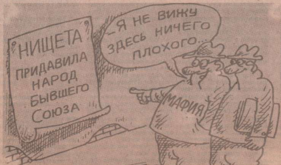
Рисунок В. Федорова.