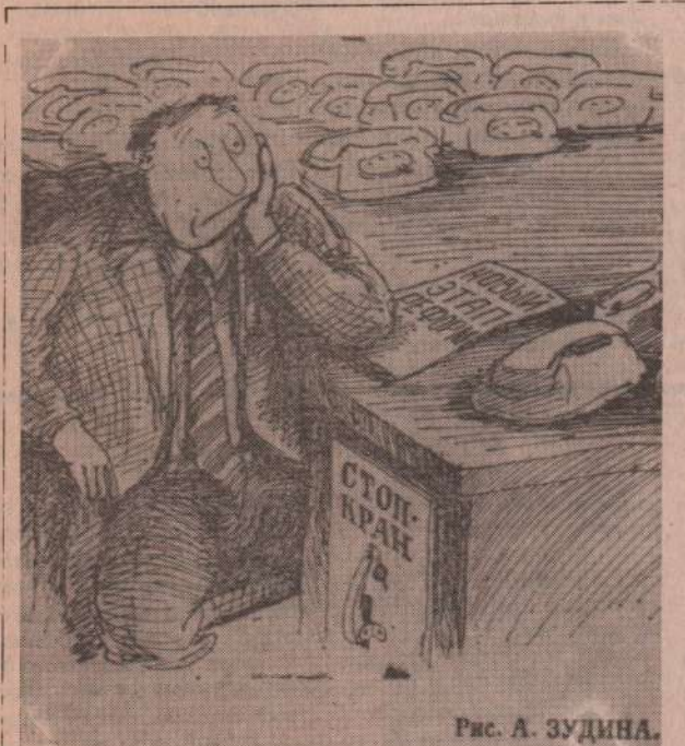
Рис. А. ЗУДИНА.

Адрес филиала: г. Каменск-Уральский, ул. Синарская, 7, тел. 3-46-35.