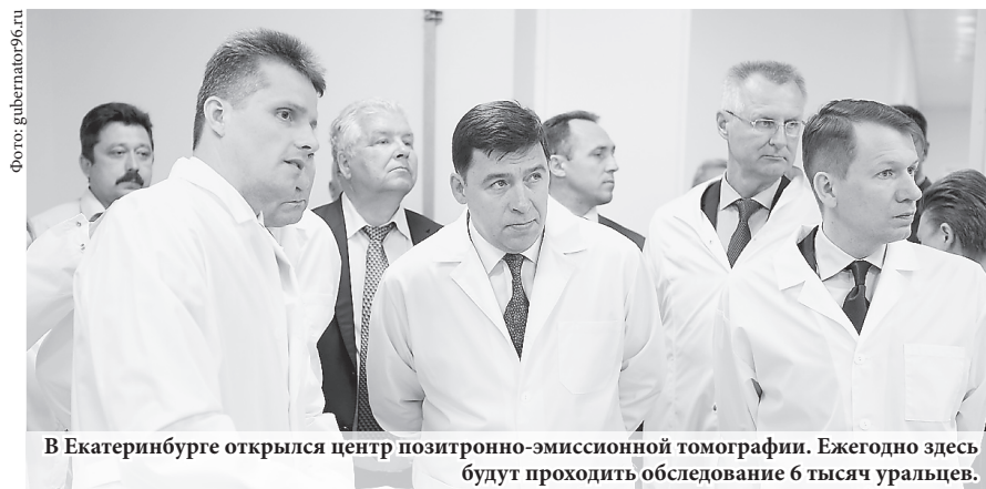
В Екатеринбурге открылся центр позитронно-эмиссионной томографии. Ежегодно здесь будут проходить обследование 6 тысяч уральцев.

Высокий профессионализм уральских медиков и усилия органов власти позволяют эффективно решать задачи сохранения здоровья свердловчан. Об этом 26 июля сказал губернатор Евгений Куйвашев на форуме медицинской общественности «Сила Урала: здоровье уральцев».