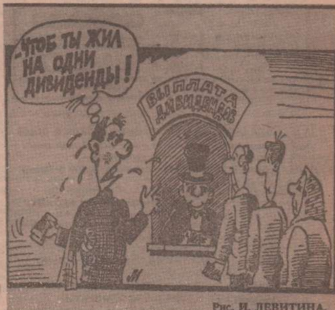
Рис. И. ЛЕВИТИНА.