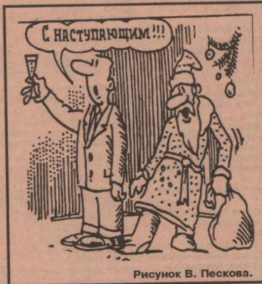
Рисунок В. Пескова.