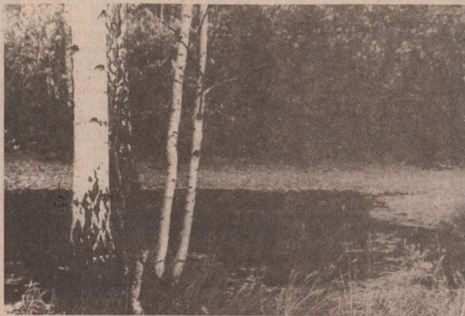
У лесного затона.