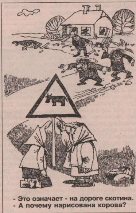
- Это означает - на дороге скотина. - А почему нарисована корова?