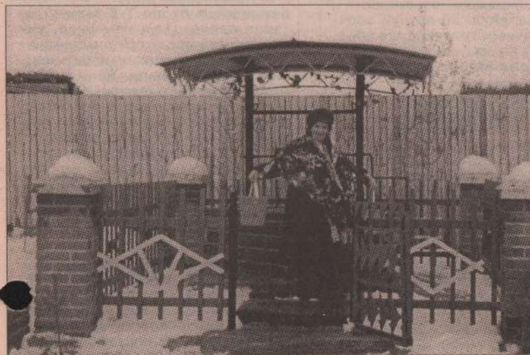
«Лидия» - Барабановская администрация

Наш район по праву может гордиться своими красивыми, живописными родниками и колодцами.