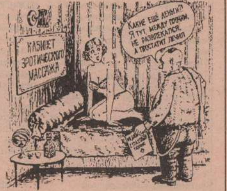
Рис. В. ВРАННИХ.