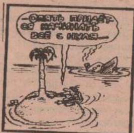
рис. В. Федорова (Челябинск)

Губернатор Самарской области Константин Титов говорит, что вскоре при помощи «Себеко» будет построено еще 20 суперферм. «Комсомольская правда».