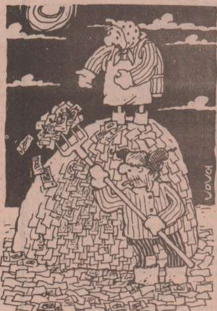
АГЕНТСТВО ЮМОРИСТОВ ЮМОРИСТОВ

27, 28 апреля. Смените одежду (новое одеяние, еже впервой надети). Не рубите деревья (древа не съсекать).