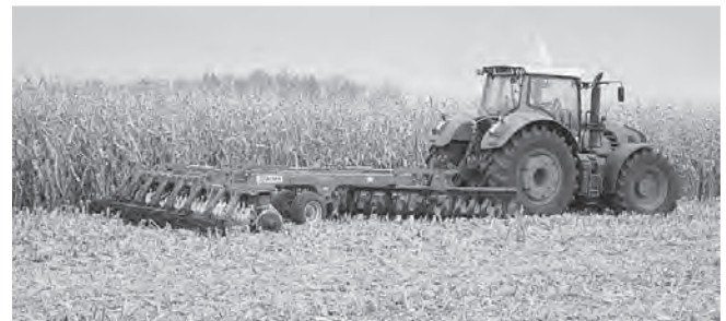
В 2015 году было отмежевано 12,6 тыс. га, в прошлом году – почти 30 тысяч, на будущий год стоит задача ввести в оборот 25 тыс. га.