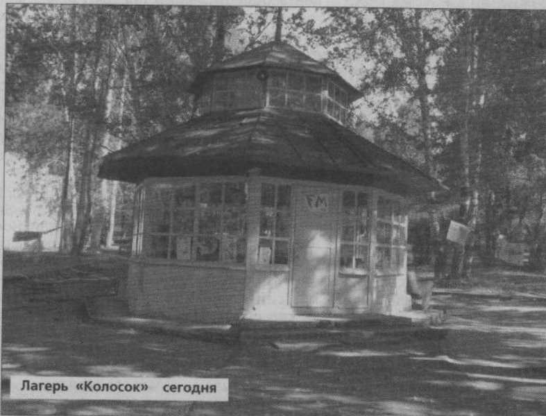
Лагерь «Колосок» сегодня