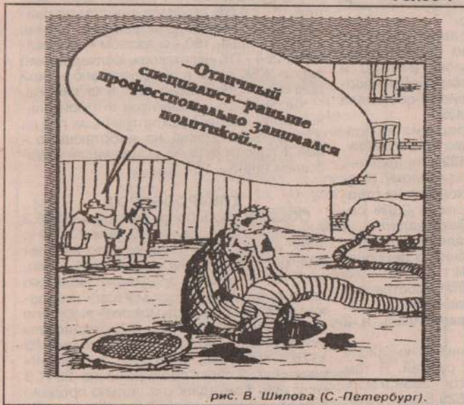
рис. В. Шилова (С.-Петербург).