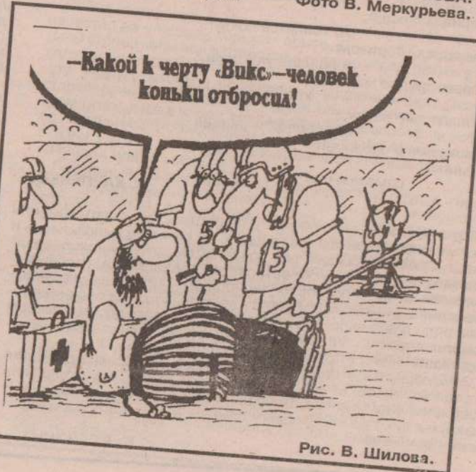
Рис. В. Шилова.