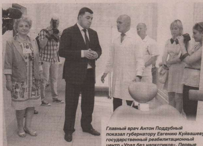
Главный врач Антон Поддубный показал губернатору Евгению Куйвашеву государственный реабилитационный центр «Урал без наркотиков». Первые пациенты - порядка 15 человек - начнут здесь лечение уже в июле.