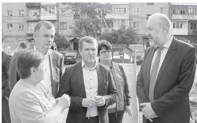
Депутат Госдумы РФ Павел Крашенинников считает, что народные избранники должны помогать решать проблемы людей.