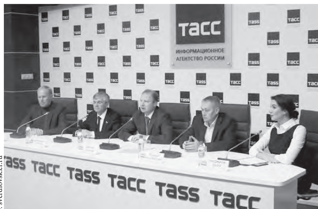
Прошла первая региональная неделя депутатов всех уровней.