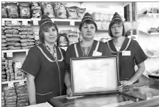
Коллектив продуктового магазина в Клевакинском награжден за хорошую работу

По пути в Клевакинское мы заехали в мастерские ПАО «Каменское», чтобы вернуть генератор. Оказывается, практически каждый рабочий день руководителей РайПО начинается с телефонограмм об отключении электроэнергии в разных концах района, на которые нужно очень оперативно реагировать. То есть срочно развезти бензиновые генераторы в магазины, попавшие в зону обесточивания. Иначе их работа будет парализована: нет электричества – не работают кассы, холодильные камеры, нет света. Значит, люди останутся даже без молока и хлеба, какие-то продукты попортятся, не будет выручки. Энергетики же не церемонятся, как правило, отключают электричество вразброс. Вот и приходится метаться по всему району. Когда не хватает собственных семи генераторов, выручает ПАО «Каменское», поясняют собеседники. Это одна из реалий, в которых сегодня приходится работать кооператорам.