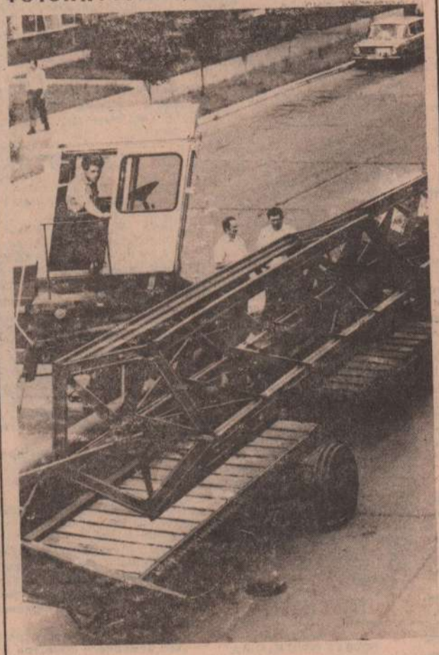
Жатки для нового урожая

Украинская ССР. Новые виды машин подготовило к страде Бердянское производственное объединение по жаткам. Одна из них самоходная валковая жатка с захватом 7,6 метра (на снимке). По сравнению со своими предшественниками она позволит значительно улучшить технологию уборки зерновых на свал, практически на нет сведя потери.