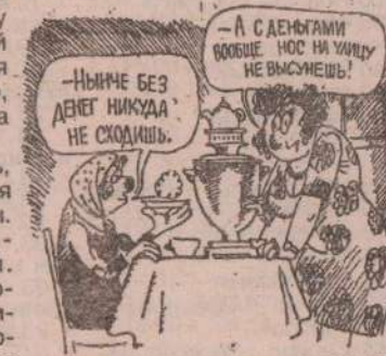
Рис. Л. ЧЕРНЫХ.