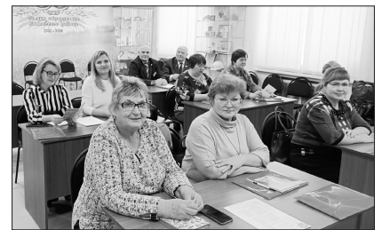
Администрация Каменского городского округа

Посетили гости и Храм Михаила Архангела. В Маминском очень много достопримечательностей, это очень светлое, уютное село, где жители сами делают все, чтобы их малая родина процветала.