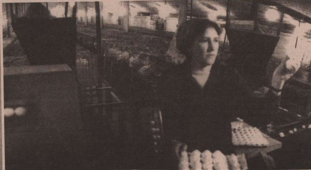
На снимке: птицефабрика в совхозе «Сосновский».