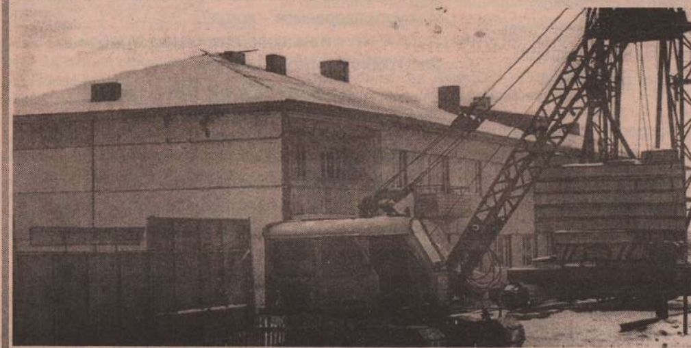
На снимке: строительство жилого дома в селе Травянском.

М. Терентьева, ведущий специалист районного архива.