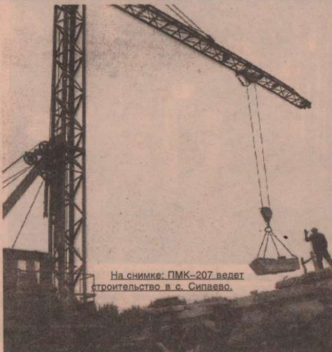
На снимке: ПМК-207 ведет строительство в с. Сипаево.

визиты делегации молодежи в ЧССР (10 человек) и др.