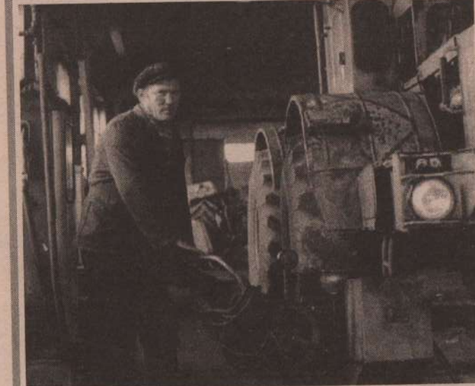
На снимке: цех по ремонту тракторов К-700 в РО «Сельхозтехника».